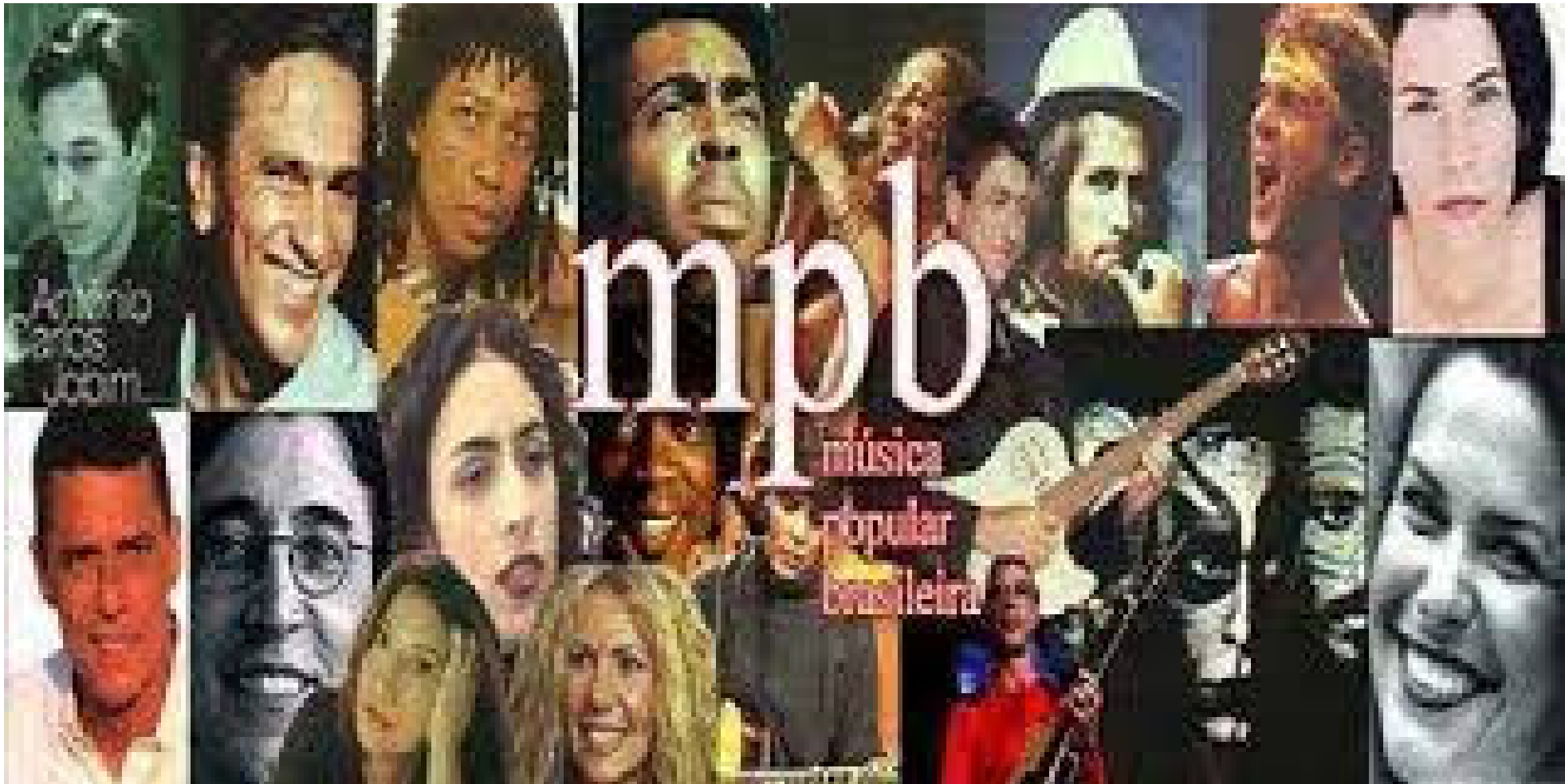
MPB – Música Popular Brasileira (imagem).