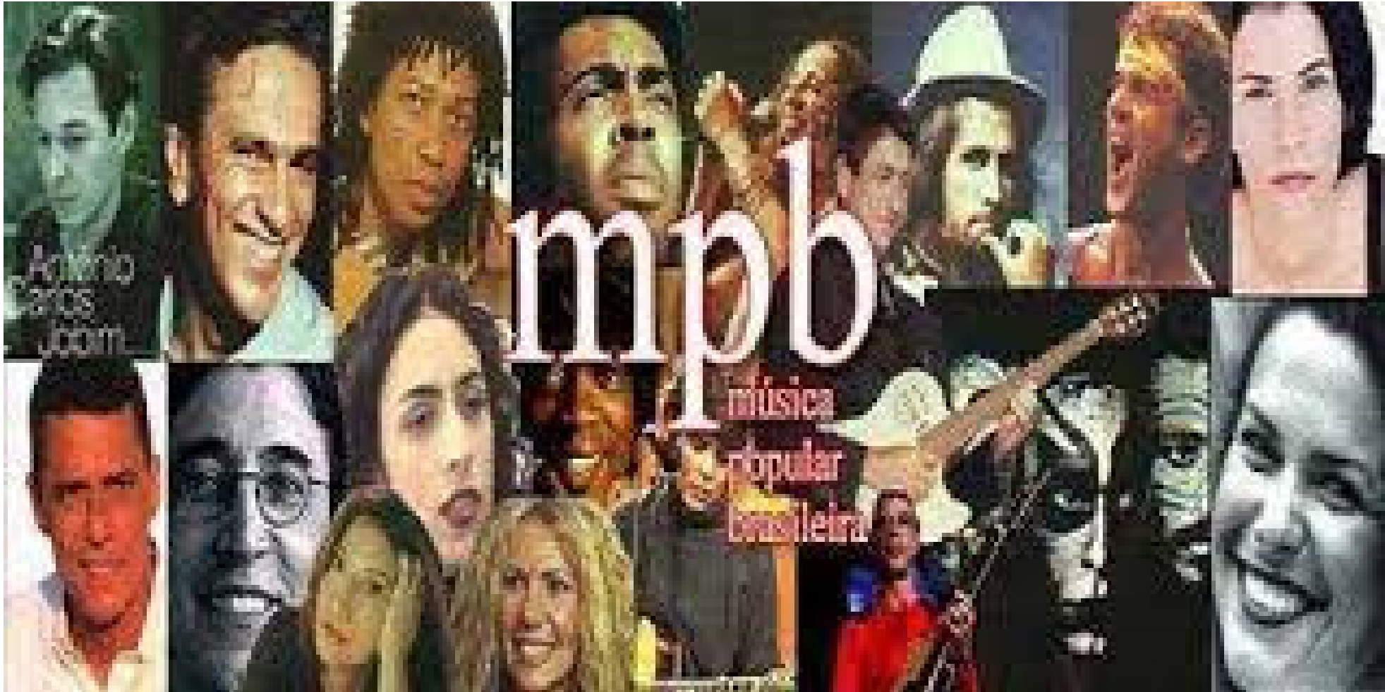
MPB – Música Popular Brasileira (imagem).