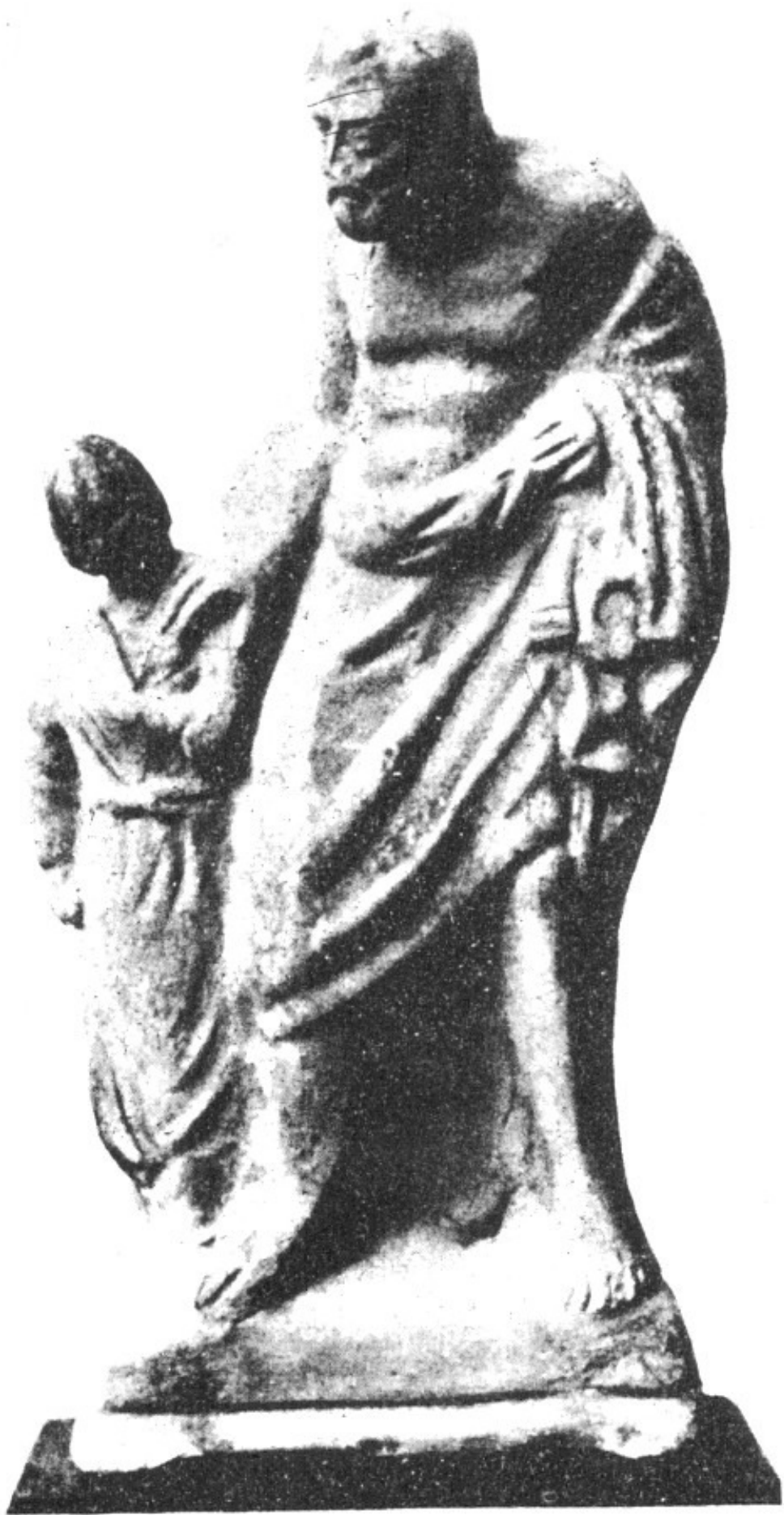
Pequenas imagens gregas de terracota retratam o escravo pedagogo conduzindo para a escola a criança.